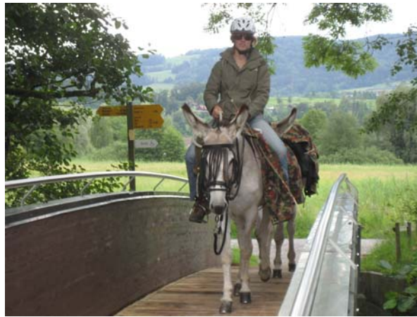
Überqueren einer Brücke

Der letzte Wandertag stand bevor. Nach meiner Planung war dies auch die längste Wanderroute der Woche! Dazwischen sogar noch der Zürisee! Nach einem Abstieg von einer Stunde Fussmarsch waren wir schon am See. Eine Journalistin wartete schon auf uns! Mit der Autofähre Horgen-Meilen überquerten wir den See. Die Esel liefen auf die Fähre, wie sie das alle Tage machen würden! In Meilen angekommen stoppten wir noch für einen Einkauf. Der nächste Hügel stand einmal wieder bevor. Auf der Hochwacht legten wir unsere verdiente Mittagspause ein. Die Esel grasten ruhig um uns herum. Im zügigen Schritt marschierten wir weiter Richtung Fehraltorf. Wir wählten den Weg über Egg, am Greifensee entlang und durch die Stadt Uster. Nun war das Ziel nicht mehr weit weg. Aber da stand noch der grosse Uster Wald bevor! Mit Hilfe von Wegweiser und Karte kamen wir in Fehraltorf am richtigen Ort aus dem Wald. Pünktlich waren wir am Ziel angekommen. Absatteln, die Esel versorgen und dann die Muli Leute begrüßen war angesagt. Wir waren glücklich, das an diesem Tag alles so gut geklappt hatte.