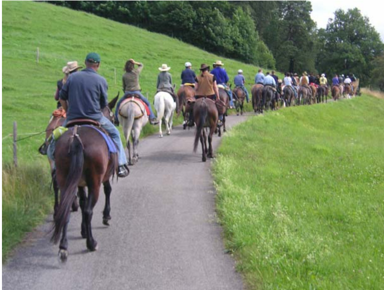
Auf dem Maultierritt am Freitag

Kessel und mit langer Gabel. Das war noch interessant. Samstag war das Jubiläums - Turnier angesagt. Man konnte geführt oder auch geritten teilnehmen. Auch unsere Esel durften mitmachen. Schon stand der letzte Abend bevor. Eine Band spielte extra für unsere Feier. Am nächsten Tag stand noch die Parade durch das Dorf auf dem Programm. Mit vielen Erinnerungen und neuen Erfahrungen reisten wir wieder zurück in das Bernbiet. Aber diesmal durften unsere Esel reiten!